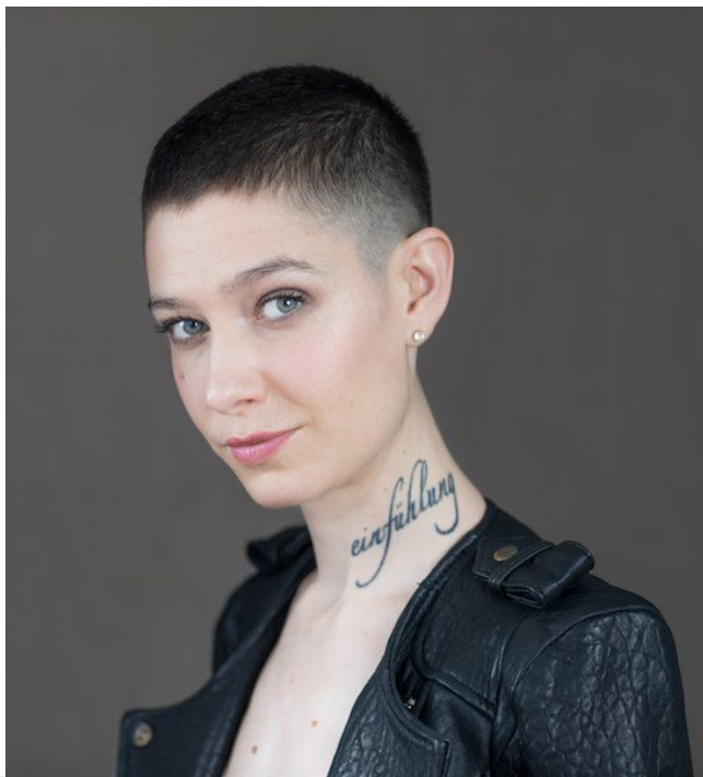
Asia Kate Dillon

Personnes non-binaires => demander poliment !