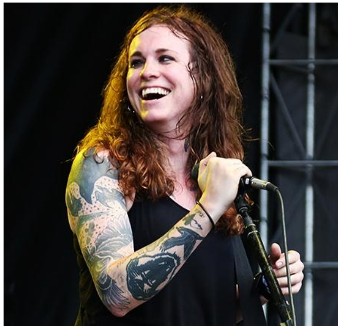
Laura Jane Grace (Against Me!)